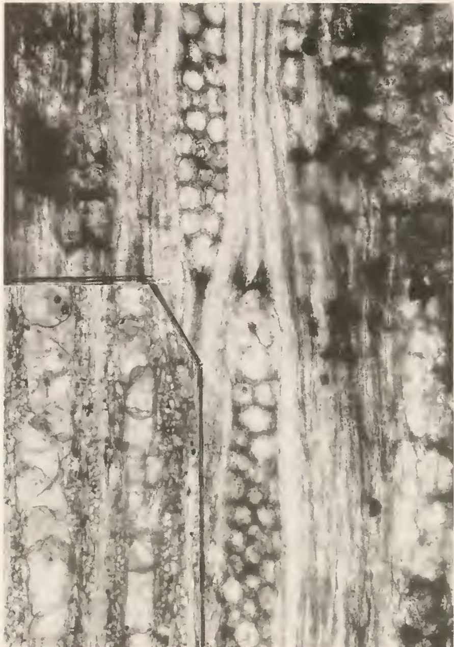
Abb. 4. Cinnamomoxylon cf. limagnense – Tangentialschliffe. 2–3reihige Holzstrahlen mit einer idioblastischen Kantenzelle; \times 210 ; unten links, Wasserleitbahnen mit dünnwandigen Thyllen; \times 70 .

ROHWER & RICHTER 1987; ROHWER, RICHTER & VAN DER WERFF 1991 (Nach GOTTWALD 1997).